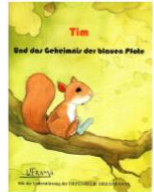
Tim en allemand

Le livret "Tim et le mystère de la patte bleue" est destiné aux enfants de 3 à 7 ans ayant un parent incarcéré. Edité en mars 2008 en langue française, une nouvelle édition a été réalisée en décembre 2016 en anglais, espagnol, italien, allemand.