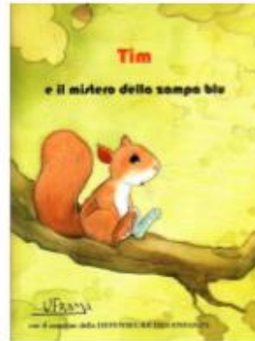
Tim en italien